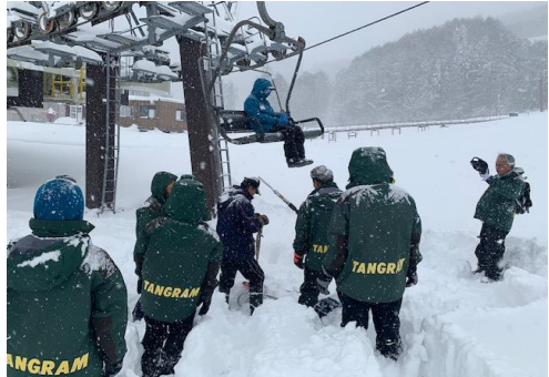
【冬季勤務前救助訓練】