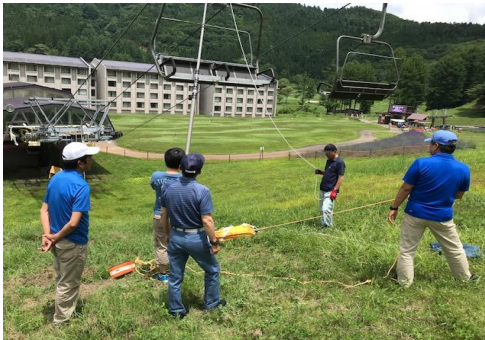
【夏季勤務前救助訓練】