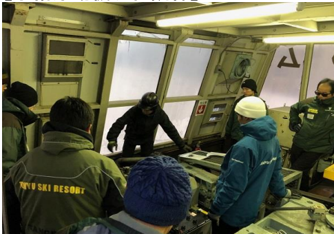
【予備原動機切替訓練】